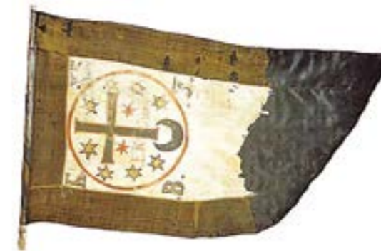
Прапор Богдана Хмельницького

В українському козацькому війську усі козацькі гетьмани і кошові отамани дотримувалися традиції вирішення питань війни і миру через відповідних посланців. Так, у період Хмельниччини у Козацькій республіці послами були полковники Ф. Джеджалій, І. Креховецький, І. Брюховецький, М. Махаринський, Ю. Немирич, М. Криса, які, крім іншого, вирішували питання укладення мирових угод.