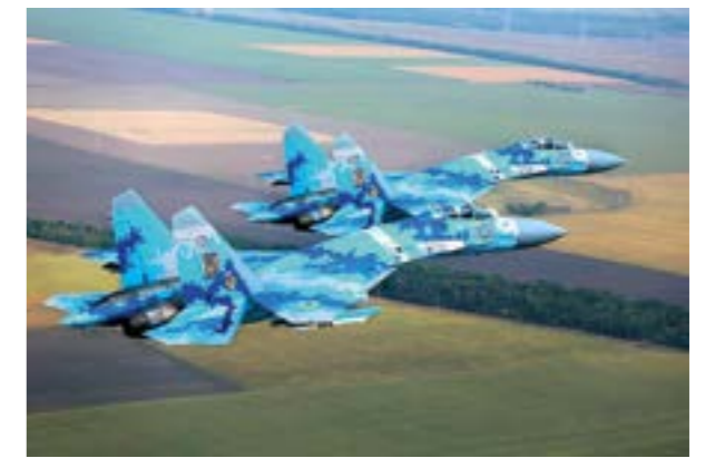
Українські бойові літаки Су-27

Суттєве значення у житті та побуті особового складу Повітряних Сил Збройних Сил України мають неформальні традиції, які не знайшли свого нормативно-правового відображення. Особливо яскраво це проявляється на