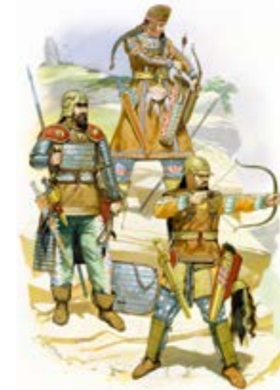
Скіфські воїни. Малюнок-реконструкція художника А. Макбрайда

Важливу роль грало формування у воїнів презирства до смерті. Скіф надавав перевагу смерті, аніж безчестю і ганьбі. Лукіаном Самосатським зафіксований серед скіфів звичай, відомий з історії японських самураїв як здійснення харакірі. Позбавленню страху перед смертю сприяли релігійні уявлення про потойбічне життя. Той, хто сумлінно виконав свій військовий обов'язок, міг розраховувати