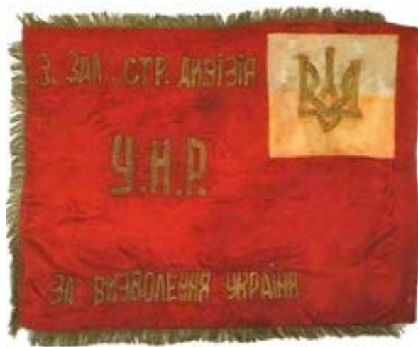
Прапор 3-ї Залізної стрілецької дивізії Армії УНР, 1919 р.

військових відділів уживання в них командних та рангових відзнак носило характер такої ж буйної ріжноманітності та подекуди анархії, як це було і з вибором та уживанням ріжноманітного військового одягу... новостворені військові частини в силу життєвої необхідності винаходили для себе самостійно та уживали своїх локальних систем, які між собою були дуже часто відмінні як внутрішньою структурою, так і зовнішнім виглядом».