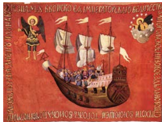
Морський прапор Війська Запорозького

Для тактики козацького війська було характерним використання воза не лише як засобу транспортування, але й як засобу бойового застосування. Народившись спочатку як засіб захисту від ворога в голому степу, табір поступово перетворився на ефективний спосіб оборони, а згодом і наступу. За допомогою возів будувалися рухомий і стаціонарний табори. Французький інженер Г. Боплан, який перебував на службі у короля Речі Посполитої, повідомляє: «Я зустрічав декілька разів у степу до 500 татар, які пробували напасти на наш табір, але нічого не могли зробити, хоч мене супроводжувало лише 50–60 козаків». У 1621 р. сорокатисячне козацьке військо здійснило марш рухомими таборами по території Молдавії в район