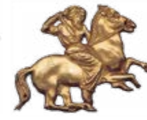
Вершник із списом