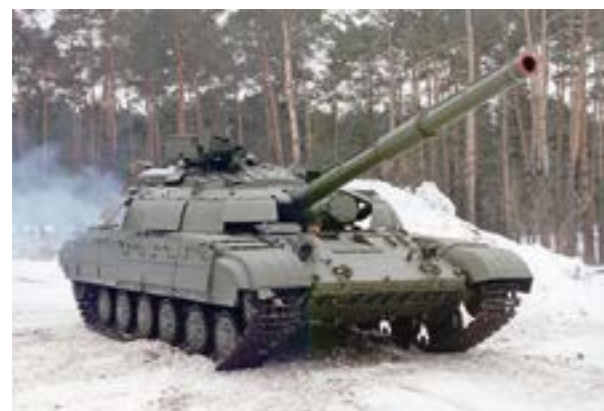
Український танк Т-64Б «Булат»

Свій прояв і подальший розвиток українські військові традиції отримують в інших умовах, зокрема під час проведення миротворчих операцій. Так, у складних умовах локального конфлікту в Іраку (негативних факторів соціально-