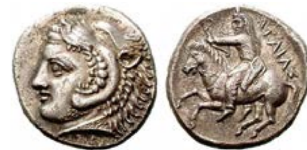
Монета скіфського царя Атея

Безпосередньо підпорядковані царям та аристократії, дружини воїнів-професіоналів стали стрижнем військової організації. У випадку серйозних воєнних конфліктів та розгортання війська вони виконували роль і резерву керівного складу, і кращих ударних частин. Залежно від завдань і потреб частину сил їх війська виділяли для забезпечення бойових дій: