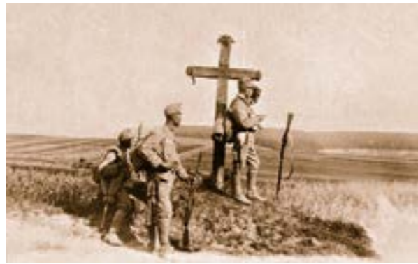
Розвідка УСС, 1915 р.