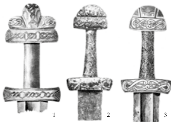
Фрагменти мечів: варязького (1) та руського типів (2, 3)

Стяг був засобом управління військами і вказував на стан справ командування. Підняти стяг (прапор) означало подати сигнал до початку бою, його згортання – відбій або відхід. Стяг охороняли спеціальні воїни-стяговіки. Втратити прапор вважалось ганьбою, а захоплення його у противника – перемогою. Ймовірно, кожний княжий полк мав свій прапор з кольорами князя, за якими можна було визначити, кому він належить. Традицію вірності Бойовому прапору руські воїни пронесли через століття, яка ще з більшою силою проявилася в інші історичні періоди.