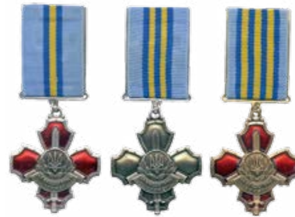
Медаль «За бездоганну службу» I, II, III ступенів

Посвячення молодих бійців у високомобільних десантних військах у військовому колективі також сповнене доброзичливим потішним