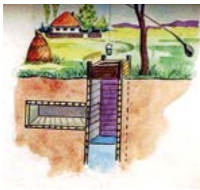
Малюнок схрону УПА, 1945 р.

Збільшення чисельності УПА (на осінь 1943 р. у ній нараховувалось близько 40 тисяч бійців) дозволяло їй командуваттю планувати й здійснювати рейдові операції. Постійний рух був важливою особливістю партизанських дій повстанських відділів. Такі рейди вирішували