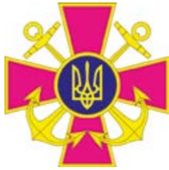
Емблема Військово-Морських Сил Збройних Сил України