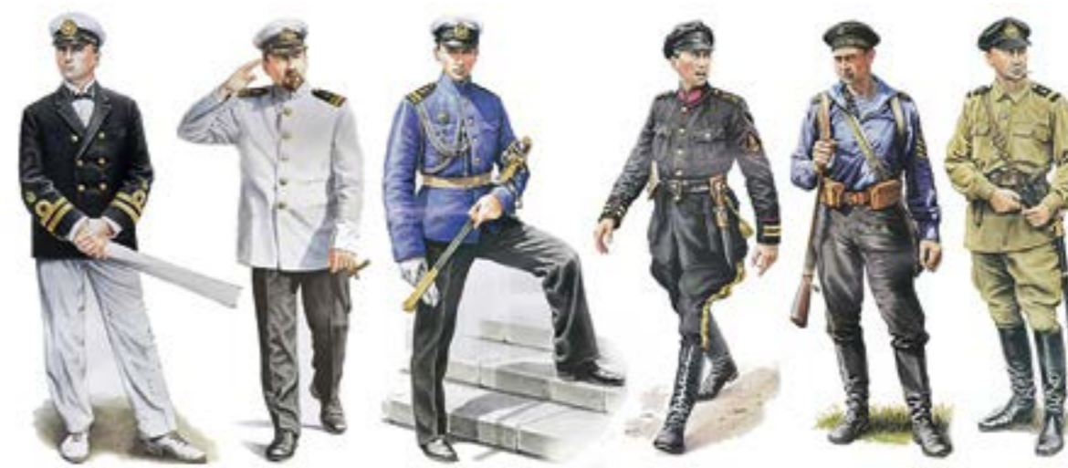
Морські однострої флоту Української Народної Республіки, 1917–1920 рр.

Відтак уже в листопаді 1918 р. присягнули усі частини й підрозділи бойових груп і запліля Галицької Армії. Задля посилення емоційного впливу в ритуалі брали участь представники