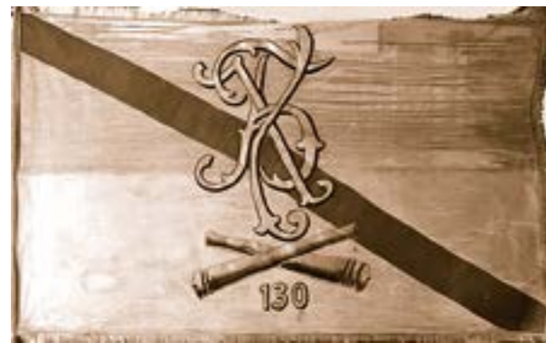
Прапор часів військових маніфестацій 1917 р.