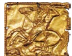
Половання на зайця