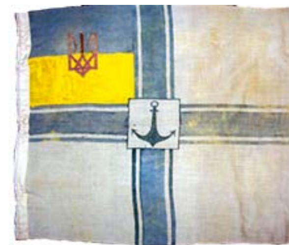
Оригінальний прапор Морського міністра Української Держави. Затверджений у 1918 р.

Вагоме місце серед бойових традицій армій українських національних державних утворень періоду 1917–1921 рр. займає традиція вірності військовій присязі і військово-обов'язку. Так, на західноукраїнських землях ще в ході збройного повстання 1–2 листопада 1918 р. його керівник полковник Дмитро Вітовський (згодом – військовий міністр Західно-Української Народної Республіки) при формуванні загонів наказував негайно приводити їх до військової присязі. Про важливість цього ритуалу свідчить те, що у першій же день створення Державного Секретаріату Військових Справ складений текст військової присязі Галицької Армії, затверджений Українською Національною Радою 13 листопада 1918 р.: «Присягаємо