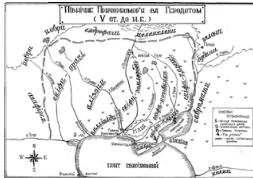
Реконструкція уявлень Геродота про Північне Причорномор'я (за М. Іваночко)

Саме в скіфській час кількість населення на землях сучасної центральної, східної та південної України зростає майже в двадцять разів, виникають городища, яким не було рівних за площею у всій Європі, з'являється така кількість