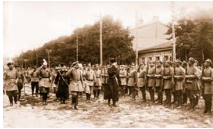
Гетьман Павло Скоропадський оглядає Сірожупанну дивізію, 1918 р.

державних і громадських органів, духовенства, місцевого населення. У Жовкві, Золочеві, Стрию, Самборі, Коломиї, Жидачеві та інших містах перші військові формування складали присягу на центральних площах. Перед вояками виступали з промовами військовики, представники громадськості, закликаючи завзято захищати Батьківщину від польських нападників, свято виконувати військову присягу.