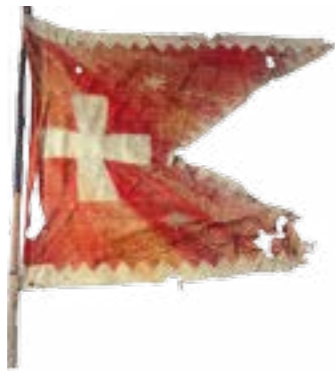
Козацький прапор, 1651 р.

Прикладом військової майстерності козаків є діяльність їх контррозвідки. Так, є свідчення, що гетьманська контррозвідка викрила багато змов проти Богдана Хмельницького, генерального писаря І. Виговського, полковників І. Богуна, Д. Нечая, П. Кривоноса й інших. Слід згадати й про те, що в якості розвідувальної «резидентури» гетьман Б. Хмельницький використовував і вірних йому священників. Православні ченці були послами в усіх таємних справах. В. Верещака, який служив у Варшаві при королівському дворі, часто надсилав Б. Хмельницькому таємні шифровані донесення про варшавські настрої