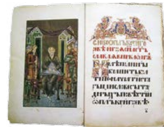
Героїчна поема «Слово о полку Ігоревім»

Незважаючи на те, що до початку XI ст. варяги вже не відігравали істотної ролі в гвардії киеворуських князів, дружина залишалася організованою на зразок варязької. Головною відмінністю було те, що замість іноземних найманців до її складу стали входити корінні русичі. Це був тривалий процес, але вже в дружині Володимира Святославовича переважав слов'янський елемент. Останні згадки про варягів є в літописі за 1036 р., коли Ярослав Мудрий привів їх з Новгороду обороняти Київ від печенігів. Після смерті Ярослава Володимировича княжі дружини складалися з місцевого населення, проте варяги багато чого передали князю війську – свою зброю, вміння нею воювати, привчили військо