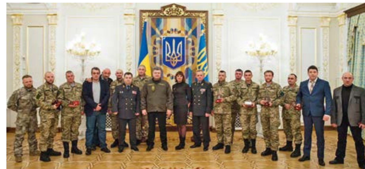
Президент України Петро Порошенко вручив нагороди захисникам Донецького аеропорту

Інша традиція — зарахування осіб, які мають особливі заслуги перед Батьківщиною, почесними солдатами до списків особового складу військових частин навічно. Вона юридично закріплена Указом Президента України від 20 липня 1998 р. «Про зарахування Героїв Радянського Союзу, осіб, нагороджених орденом Слави трьох ступенів або чотирма і більше