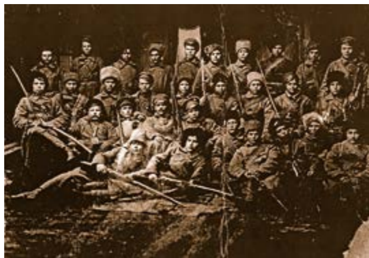
Уродженці Буринщини (Сумська область), які вступили до сформованого козацько-стрілкового полку Української Держави, Путивль, 1918 р.

Свідомого характеру військова дисципліна в армії могла набрати тільки при постійній ідеологічній роботі. Виходячи з цього, вище військове керівництво вживало належних заходів для підвищення авторитету командного складу. Цьому сприяло і рішення про відновлення персональних військових звань. Вони відновлювалися в часи Гетьманату, а потім скасовувалися після приходу до влади Директорії. Зокрема у період Директорії Української Народної Республіки (1920 р.) старшинам української