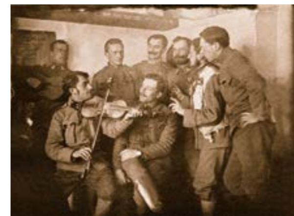
Українські Галицькі Стрільці булавного відділу І полку Легіону УСС

Ще одним із напрямів діяльності Пресової Кватири було збирання матеріалів і документів