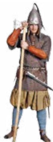
Озброєння руського дружинника. X ст. Реконструкція