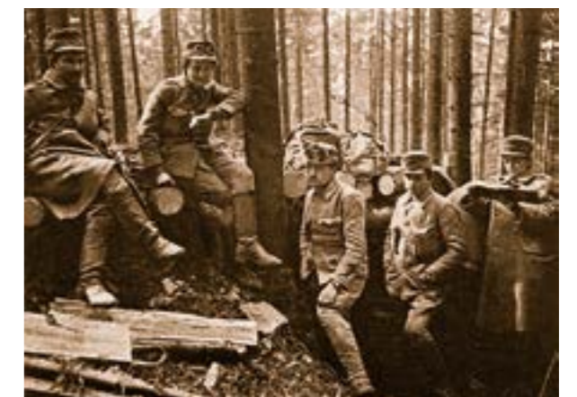
Легіон УСС в Карпатах на горі Маківка, березень 1915 р.

Отже, можна стверджувати, що військові традиції в Легіоні Українських січових стрільців базувалися і розвивалися на патріотичних засадах і досягненнях попередніх поколінь, зокрема за часів княжої доби та українського козацтва, і досягли високого рівня. У такий спосіб були примножені традиції українських військових формувань, що були важливим чинником їх високого морального духу. Ці традиції доцільно враховувати в практиці патріотичного виховання особового складу Збройних Сил України.