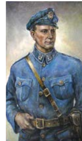
Генерал-хорунжий Роман Шухевич

метою навчання майбутнього командира було оволодіння бойовою тактикою. З цією метою курсанти вивчали бойові статуті різних армій (головним чином радянської, німецької та польської). Спеціально вивчалися різні варіанти партизанської тактики (марші і пости; бій в особливих умовах; наступ, оборона і плановий відхід; нальоти і засідки; тактика боротьби десантних підрозділів; вогнева дисципліна; бойові завдання для автоматників; маневрування; віддача бойових наказів та ін.). Завершували курс підготовки польовими заняттями.