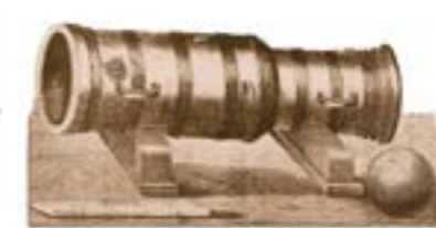
Бомбарда – гармата великого калібру, XV ст.