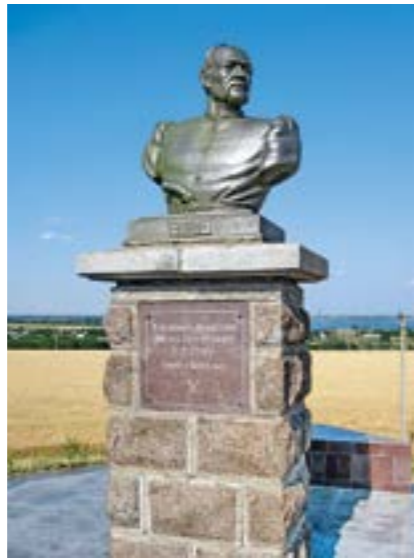
Могила кошового отамана Запорозької Січі Івана Сірка

В українському козацькому війську підтримувалась традиція поваги козаків до своїх старшин і захисту їх у бою. Серед козаків найбільшим авторитетом користувалися гетьмани Д. Вишневецький, П. Сагайдачний, М. Дорошенко, Б. Хмельницький, П. Дорошенко та інші. Особливої поваги набули кошові отамани І. Сірко й К. Гордієнко. Серед полковників козаків найчастіше відзначали І. Богун, М. Кривоноса, П. Калнишевського, Д. Нечая, М. Небабу, Ф. Джеджалія та інших. За твердженням дослідників, козаків були готові віддати своє життя за полковника Тимоша Хмельницького – не