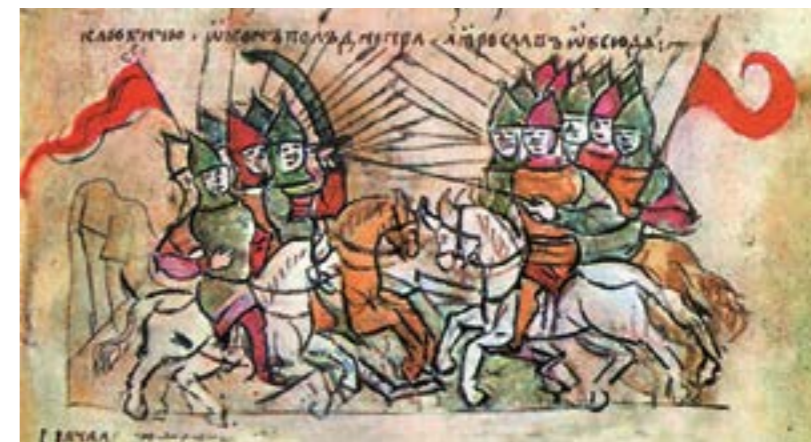
Битва Ярослава та Святополка. Мініатюра Радзивілівського літопису

Згадують літописи і гуманне ставлення русичів до полонених. Іпатіївський літопис під рік