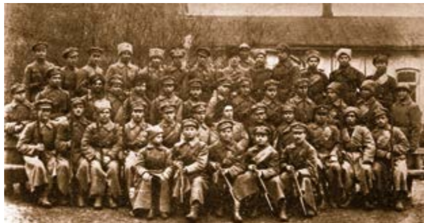
Сотня 1 полку УСС, Київ, березень 1918 р.