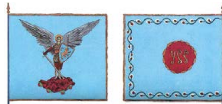
Прапор Українських січових стрільців

і виховання, традиції військового побуту та взаємин. Серед бойових традицій Легіону Українських січових стрільців виділяється традиція присягання на вірність монарху і Батьківщині. Так, 3 вересня 1914 р. у м. Стрий (на Львівщині) українське січове стрілецтво присягало