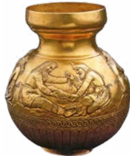
Зображення скіфських воїнів на посудині з кургану Куль-Оба, IV ст. до н.е.

Виснаживши противника, підірвавши морально-бойовий дух його війська і, разом з тим, об'єднавши свої сили з союзниками, скіфи вирішили дати бій Дарію. Стратегічна і тактична ініціатива вже повністю належала скіфам. При цьому Геродот уперше відзначає появу піхоти у війську скіфів. Перси не прийняли битви, а вдалися до втечі. Основною особливостю стратегії скіфів у війні