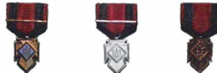
Хрест Заслуги (Золотий, Срібний, Бронзовий)

ною особливістю Української Повстанської Ар-мії став особистий героїзм командирів і політ-виховників. Це піднімало авторитет старшин в очах повстанців і місцевих жителів, служило вагомим аргументом у пропагандистській і ви-ховній роботі. Так, восени 1944 р. війська НКВС проводили велику облаву в Чорному лісі. З ме-тою забезпечення виходу з оточення основних сил, курінь командира Гамалії прийняв на себе найбільший удар противника. Під час бою 1 листопада важкопоранений Гамалія стриму-вав атаки, рятуючи своїх повстанців, а потім у безвихідній ситуації оточення застрелився.