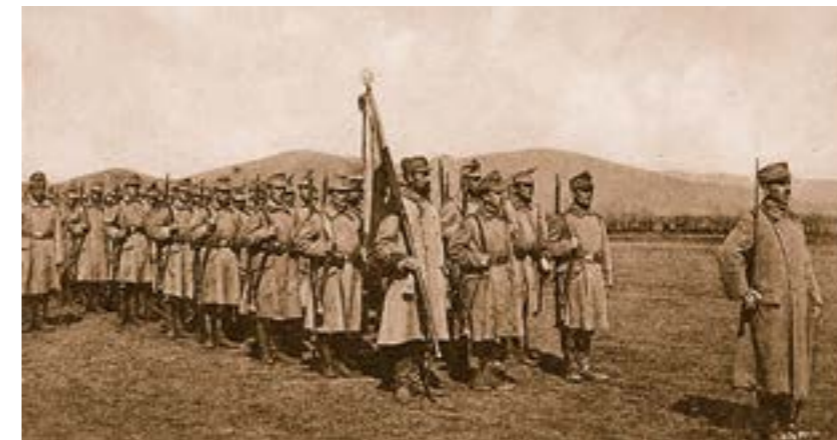
Українські січові стрільці на марші