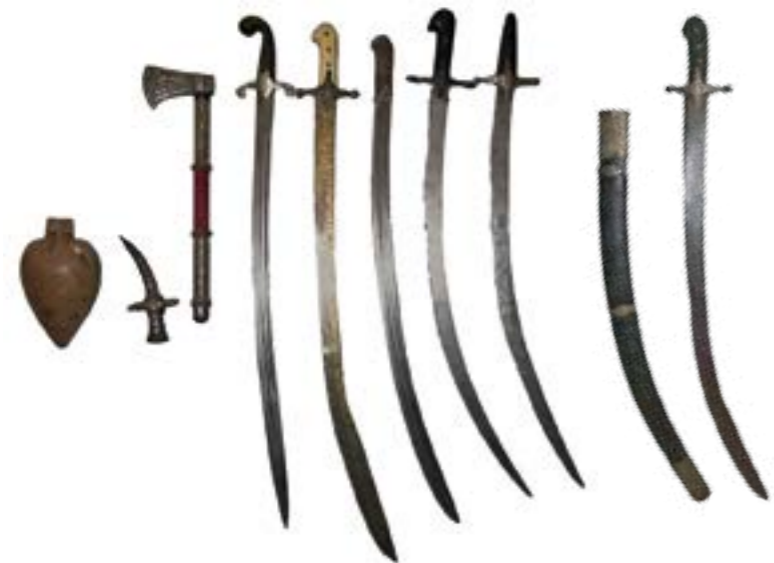
Козацька зброя ближнього бою, XVII ст.

Традиція самопожертви заради загальної перемоги над ворогом і збереження життя бойових товаришів знайшла чітке відображення в українській історії під час битви польсько-українського війська з турецько-татарською армією біля молдавського села Цецори у вересні 1620 р. Восьмитисячне польсько-українське військо на чолі з коронним гетьманом С. Жолкевським протистояло стотисячній турецько-татарській армії очолюване великим візірем османського султана Іскандером-паші. Без вагомих причин у польському війську виникла паніка і воно стало відступати під захистом табору з возів. Через відсутність чіткого управління рухомим табором польське військо в районі Могилева-Подільського допустило його розрив, у який увірвалась татарська кіннота. Козаки самотужки не змогли стримати ворога, але взято билися до останнього. Військо С. Жолкевського було повністю розгромлено. Проте, українські козаки вкотре продемонстрували свою здатність до самопожертви заради спільної перемоги. Яскравим проявом цієї традиції є дії гетьмана І. Мазепи і кошового отамана К. Гордієнка після досягнення