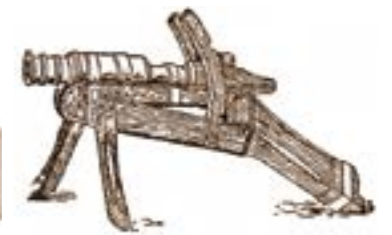
Гармата для оборони замків «тарасниця», XV ст.

українсько-шведських домовленостей на початку XVIII ст.