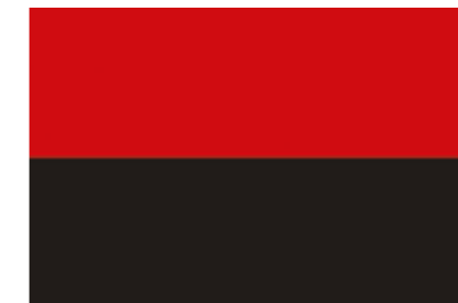
Революційний прапор ОУН