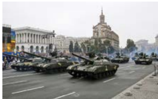
Військовий парад на Хрещатику

Традиційними у Сухопутних військах є заходи щодо підготовки і проведення державних свят і відзначення пам'ятних подій – Дня