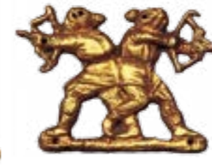
Скіфські лучники у бою