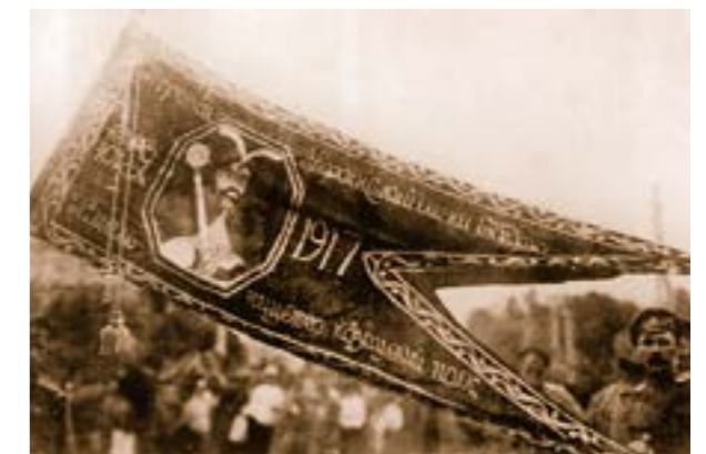
Прапор Богданівського полку