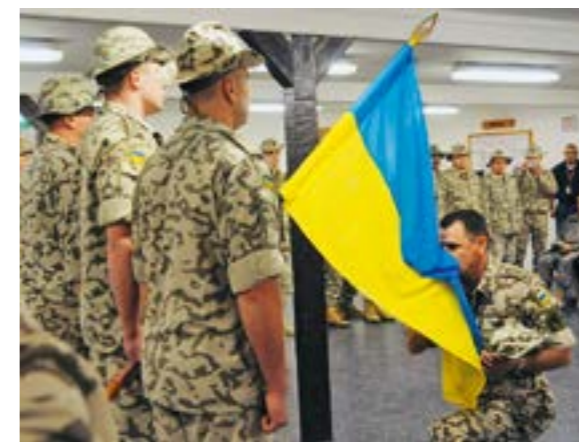
Церемонія закінчення української миротворчої місії в Іраку, 9 грудня 2008 р.

За час перебування українського миротворчого контингенту в Республіці Ірак українськими миротворцями також було започатковано традицію надання лікарняної допомоги постраждалим з числа місцевого населення. Кваліфіковану медичну допомогу отримали майже 40 тис. хворих, серед яких — іракські військові та місцеві мешканці, військовослужбовці інших контингентів багатонаціональної дивізії «Центр-Південь».