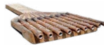
Козацька багатоствольна гармата (т.зв. «шмигівниця» або «органка»)