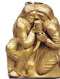
Сцена обряду поворотимства скіфів

Таким чином, у скіфів проявилися ті кардинальні зміни, які сучасні воєнні теоретики відносять до революції у військовій справі: принципові технологічні зміни в озброєнні (створення ефективного комплексу зброї та захисного озброєння на основі переходу до масового використання металу); створення нових військових організаційних і функціональних компонентів (формування професійного компонента війська, використання загонів важкоозброєної кінноти); принципово нові підходи до форм і методів ведення збройної боротьби (застосування асиметричних дій на воєнні загрози, використання можливості досягнення перемоги у війні без зіткнення з противником у вирішальній битві, надання переваги дистанційному безконтактному бою, використання стратегічних базових районів для свого війська у безпосередній близькості до театру воєнних дій та ін.).