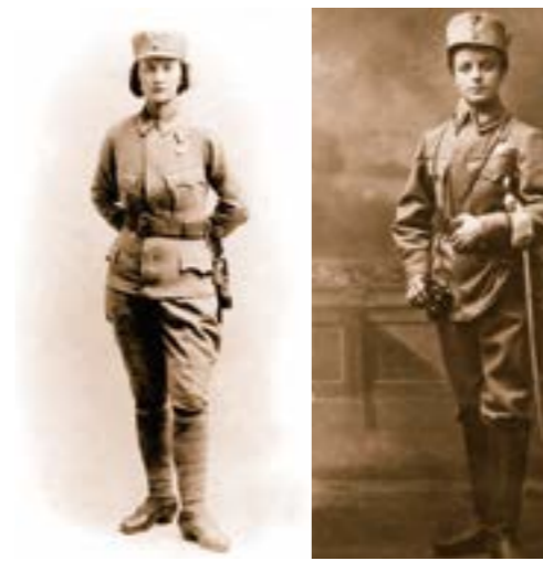
Перша українка-офіцер, хорунжа УСС Олена Степанів, 1917 р.