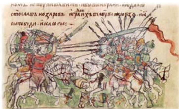
Битва військ Святослава Ігоровича з військами хозарського князя Кагана. Мініатюра Радзивілівського літопису

Якщо новачок проходив з честю всі три круга, в урочний день вся дружина збиралася на капищі, де жрець проводив над ним обряд військової посвятки – ініціації, що означала початок