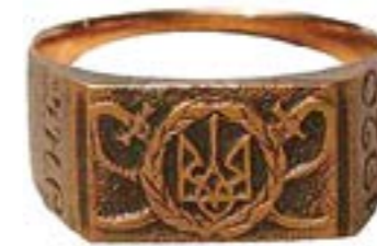
Перстень в пам'ять Першого Зимового походу

армії поверталися ті військові звання, які вони мали під час служби в Російській, Австро-Угорській та Українській (доби Гетьманату) арміях. Відновлені звання узгоджувалися з посадовими ступенями, які існували в Армії Української Народної Республіки, встановлювалися їх відповідність. Найменування військових звань і посад тісно було пов'язане з національно-історичними традиціями українських військових формувань, зокрема запорозького козацтва, січового стрілецтва, що мало безперечний вплив на зміцнення національної свідомості та військової дисципліни.