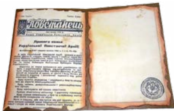
Присяга вояка УПА та печатка Головного командування

Повсякденна життєдіяльність по-встанців підпорядковувалась чіткому розпорядку. Згідно зі спеціально роз-робленими «правильниками», повста-нець розпочинав свій день із «ранньої зорі», після чого проводились фізич-на зарядка, прибирання та умивання. Згодом підстаршина подавав команду збиратися до молитви, після якої чер-говий оголошував збір до сніданку.