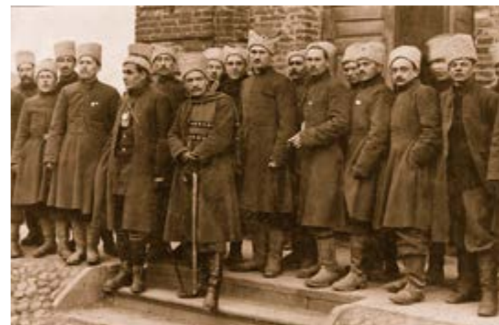
1-а українська дивізія (Синьожупанники) у Ковелі перед відправленням до Києва

Традиція любові до своєї частини була тісно пов'язана з іншою бойовою традицією – вірності воїнів Бойовому прапору, яка високо цінувалася у всі часи. Бойові прапори стали справжніми символами воїнської честі, доблесті і слави, символами духовного єднання воїнів. Так, прапор 1-го Українського козацького імені гетьмана Богдана Хмельницького полку, вишитий черницями київського Флорівського монастиря, пройшов хрещення у боях і здобув свою історію. Під час відступу з Києва в ніч з 8 на 9 лютого 1918 р. група богданівців, у яких знаходився прапор, була відрізана від своїх підрозділів і змушена залишитися в окупованому більшовиками Києві. Прапор переховували на замській дачі одного з відомих українських політичних діячів, а після вступу військ Центральної Ради до Києва він був повернений у полк. У подальшому цей прапор пройшов весь бойовий шлях з Армією Української Народної Республіки і після завершення війни опинився у Празі, де зберігався в Українському кабінеті чеського міністерства закордонних справ (зник у травні 1945 р. – під час боїв радянських військ за Прагу).