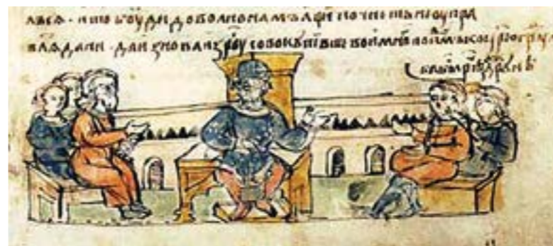
Святослав радиться зі своїми дружинниками. Мініатюра Радзивілівського літопису

Не викликає сумнівів, що руські воїни складали клятву на вірність своєму князю. Як проходив цей ритуал достеменно не відомо, але «Повість минулих літ» описує ритуал клятви про вірність виконання умов договору з візантійським царем: «А нехрещені руські кладуть свої щити і виїняті мечі, обручі та іншу зброю, щоб поклястися»; «Прийшли на пагорб, де стояв Перун; і склади зброю свою, і щити, і золото, і присягали Ігор і люди його – скільки було