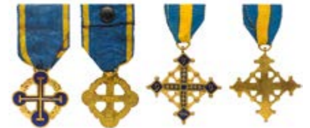
Галицький Хрест, військова відзнака УГА, заснована у серпні 1928 р. колегією старшин для всіх бійців армії

армії поверталися ті військові звання, які вони мали під час служби в Російській, Австро-Угорській та Українській (доби Гетьманату) арміях. Відновлені звання узгоджувалися з посадовими ступенями, які існували в Армії Української Народної Республіки, встановлювалися їх відповідність. Найменування військових звань і посад тісно було пов'язане з національно-історичними традиціями українських військових формувань, зокрема запорозького козацтва, січового стрілецтва, що мало безперечний вплив на зміцнення національної свідомості та військової дисципліни.