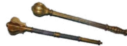
Козацькі клейноди: булава та пернач

Під час війни під проводом Б. Хмельницького у 1648–1654 рр. православне духовенство мало своє представництво у козацькому війську, підтримуючи традицію благословення війства перед боєм. Так, перед битвою під Пилявцями у вересні 1648 р. православні священники правили у війську молебні, позитивно впливаючи на бойовий дух козацтва.