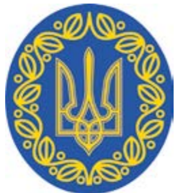
Герб Української Народної Республіки

Саме в українізованих частинах знаходить своє втілення традиція почесного найменування військових формувань. Стосовно цього існували реальні вказівки, які надавала Центральна Рада і тиражувала військова преса: «Такі війська приймають назву або просто Українських, або зветься ще й іменем українських національних героїв, які боронили волю і права українського народу». Так, влітку 1919 р. 3-й дивізії полковника О. Удовиченка, за проявлені мужність та героїзм у боях під Могилевом-Подільським за Вапнярський залізничний вузол з Південною групою військ Червоної армії, надано почесну назву «Залізна». Усі наддніпрянські дивізії одержали топонімічні іменування – Київська, Волинська, Херсонська, Подільська, як і бригади – Одеська, Козятинська, Білоцерківська. Існували й Чигиринський, Полтавський, Одеський, Чернігівський полки. Усі бригади Галицької Армії, за винятком I Української