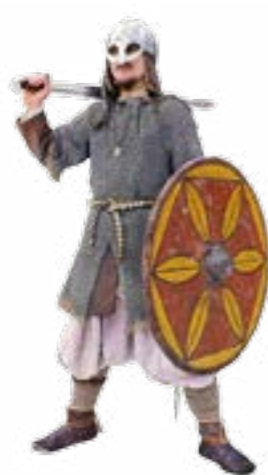
Озброєння руського дружинника. X ст. Автор реконструкції В. Остроменцький