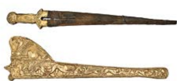
Скіфський парадний меч із золотим окуттям руків'я та золоті піхви, курган Товста Могила, IV ст. до н.е.