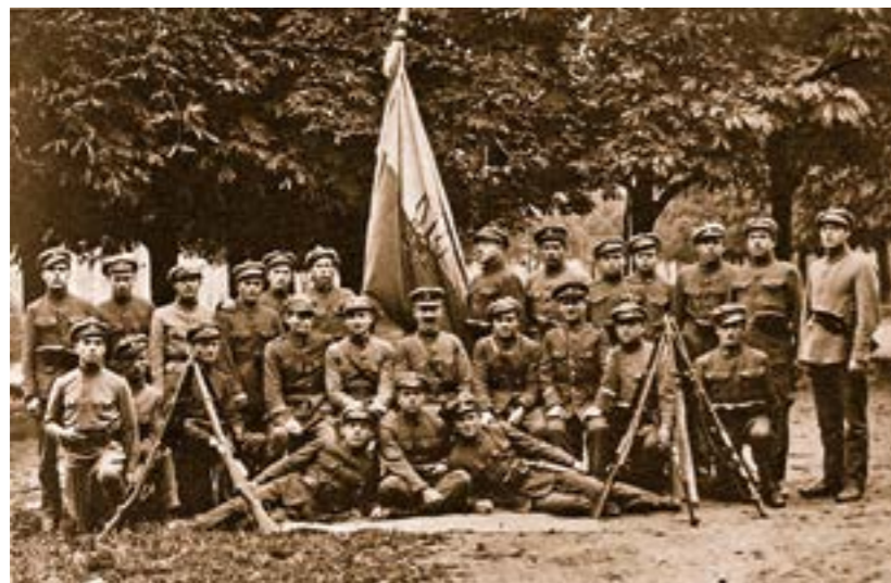
Вояки Української Галицької Армії, 1918 р.

Надзвичайною стала традиція вшанування пам'яті загиблих військовослужбовців. Цей ритуал відомий ще з давніх часів. Воїнів, які полягли на полі бою, військо хоронило особливо урочисто. Вшанувались також місця, де в бою склали свої голови рядові вояки: на тому місці ставили хрест. Ритуалу поховань полеглих воїнів з обов'язковою участю священника, військових підрозділів та військового оркестру у присутності місцевих жителів навколишніх сіл неухильно дотримувались в Галицькій Армії. На кожній могилі ставили хрест з таблицями і написами, у місцях колективних поховань створювали військові цвинтарі.