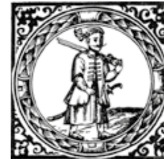
Герб Війська Запорозького, поч. XVII ст.

В історії українського народу на зламі середньовіччя — раннього нового часу виник такий своєрідний суспільний феномен, як козацтво. Це унікальне явище є однією із славетних сторінок української історії. «Ukrania terra cossacorum» («Україна — країна козаків») — так вже понад п'ять століть тому почали називати сучасники-іноземці нашу землю. Українці, в їх свідомості, тривалий час асоціювалися саме з цим мужнім, відважним і загартованим у битвах соціальним станом.