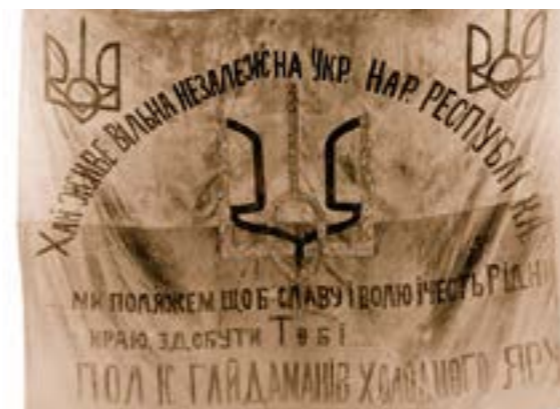
Прапор Гайдамацького полку Холодного Яру

За часів Української Держави розробкою символіки для українського флоту займалася спеціальна комісія, яка запропонувала Андрієвський прапор, з огляду на те, що «більшовицька Росія відмовилася від його використання, а українці мають на це право, зважаючи на внесок у розвиток російського флоту та перекази про прихід на береги Дніпра Андрія Первозванного. Традиційні біло-сині кольори були кольорами ще і святого заступника міста Києва архангела Михаїла, зображення якого зустрічалося на козацькій корогві ще у XV ст.». На прапорі командувача флоту квадрат з якорем