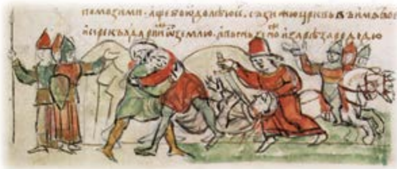
Поєдинок Мстислава Володимировича з касозьким князем Редедю. Мініатюра Радзивілівського літопису

Своєрідним елементом військових традицій була музика, за допомогою якої русичі піднімали свій дух і залякували ворога. Коли потрібно було повідомити населення про похід, давали знак трубами: «Ізяслав ударив у труби, скликав киян і пішов з Києва в похід за полками своїми». Бойові труби відомі як неодмінний військовий атрибут з XII ст.: «Під трубами повиті..., з кінця списа вигодувані». Разом з барабанами і бубнами вони використовувалися для управління військами шляхом подачі сигналів для початку атаки, збору розсіяних полків під княжий стяг або підбадьорювання своїх воїнів у найважчі хвилини битв, штурмів або оборони фортець. Так, у 1126 р. у війську князя Юрія було 13 прапорів, труб і бубнів — 60; у війську Ярослава знамен — 17, труб і бубнів — 40. Якщо припустити, що у кожного полку був свій прапор, то на один прапор доводилося по 2–4 труби і бубни для кожного