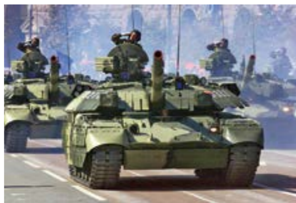
Український танк «Оплот»

політичної обстановки, незвичних кліматичних умов тощо) український миротворчий контингент зробив значний внесок у відновлення цивільної інфраструктури провінції Васіт, продемонструвавши високий професіоналізм, шанобливе ставлення до місцевого населення тощо. За час перебування в республіці Ірак українськими військово-службовцями знищено майже 1850 тис. боєприпасів, вилучено 825 одиниць зброї, здійснено понад 3 тис. конвоїв та 14 тис. патрулювань. Українськими миротворцями підготовлено 6 тис. воїнів іракської армії, реалізовано майже 350 проєктів по відновленню соціальної та матеріальної інфраструктури. На знак успішного виконання миротворчої місії Бойовий прапор 81-ї тактичної групи Збройних Сил України, яка виконувала миротворчу місію в республіці Ірак, знаходиться в експозиції військово-історичного музею Західного оперативного командування.