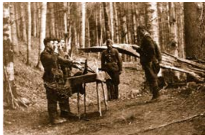
Прийняття присяги вояками УПА

За особливу працю для Української Пов-станської Армії військової та цивільні особи нагороджувались «Золотим хрестом заслуги», «Срібним хрестом заслуги» та «Бронзовим