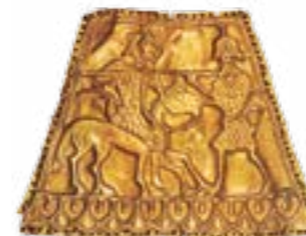
Бій кінного з пішим