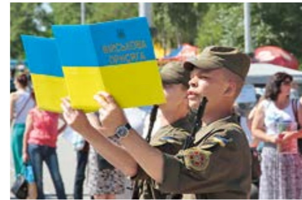
Присяга на вірність Українському народу

Вірні Військовій присязі, військового обов'язку, українському Військово-Морському Прапору, вій-