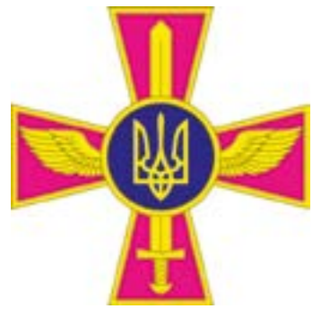
Емблема Повітряних Сил Збройних Сил України