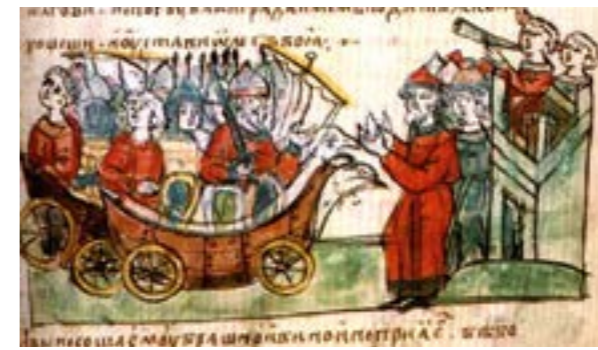
Похід Олега на Царгород. Мініатюра Радзивілівського літопису

За службу князеві воїни отримували від нього плату. Це була не лише частина данини з підкорених племен, з торгівлі, військової здобичі, – визначні члени дружини призначались