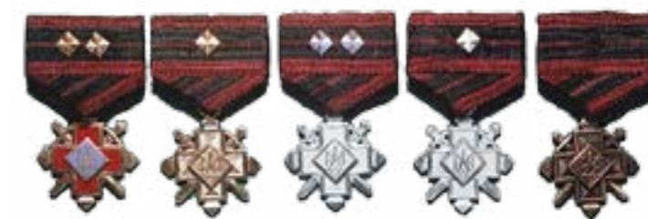
Хрест бойової заслуги (Золотий, Срібний, Бронзовий)

Продовженням традицій героїзму поперед-ників стала традиція свідомої самопожертви вояків в інтересах українського народу. Вираз-