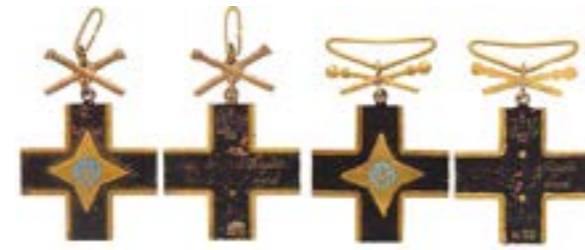
Орден Залізного Хреста Армії Української Народної Республіки, затверджений 19 жовтня 1920 р. Головним Отаманом військ УНР С. Петлюрою, який був призначений для всіх учасників Першого Зимового походу 6 грудня 1919 р. — 6 травня 1920 р.