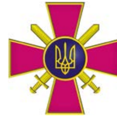
Емблема Збройних Сил України