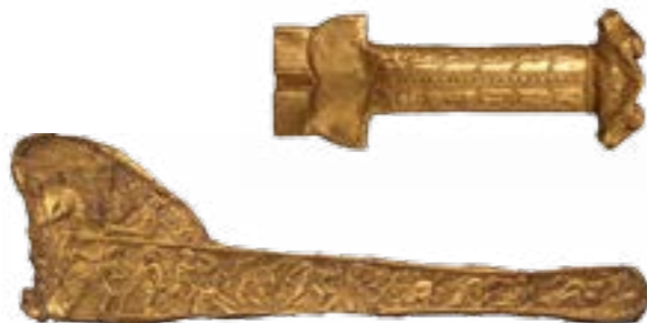
Золоті окуття руків'я та піхви меча, курган Чортомлик, IV ст. до н.е.