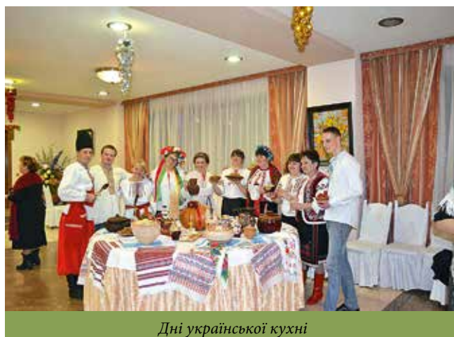
Дні української кухні

ництво яких потребує менших затрат, а споживча цінність та смакові якості залишаються на високому рівні. У зв'язку з цим проводиться значна робота, пов'язана з розробкою нового асортименту кулінарних, кондитерських та хлібобулочних виробів з урахуванням сучасних тенденцій розвитку кулінарного, кондитерського та хлібопекарного виробництва на основі впровадження новітніх технологій; застосуванням нових видів сировини (мигдалевого борошна, сумішів, до складу яких входять житнє борошно, насіння соняшника, сім'я льону, пшеничного борошна грубого помолу, кукурудзяного борошна, пшеничної клейковини та ін.), вивченням їх переваг порівняно з існуючими видами.