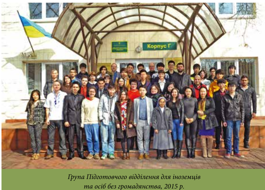
Група Підготовчого відділення для іноземців та осіб без громадянства, 2015 р.