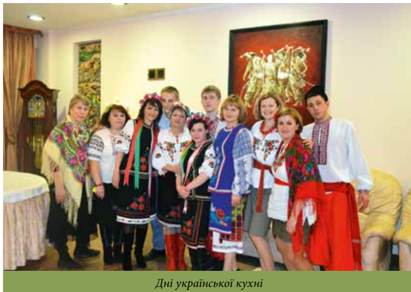
Дні української кухні

На сьогодні виробничі цехи, зали обслуговування НВО оснащено сучасним технологічним обладнанням, використовуються передові технології приготування страв. Щоденно тут проходять практичну підготовку 30–40 студентів університету і його структурного підрозділу — Вищого комерційного училища, отримують гаряче харчування понад 5 тис. співробітників і студентів. Під