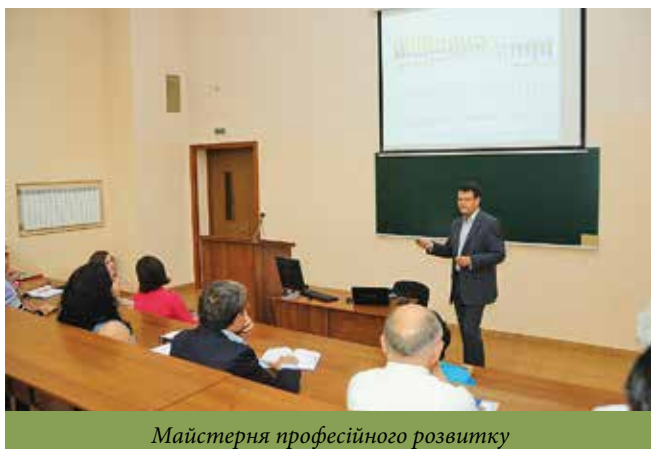
Майстерня професійного розвитку