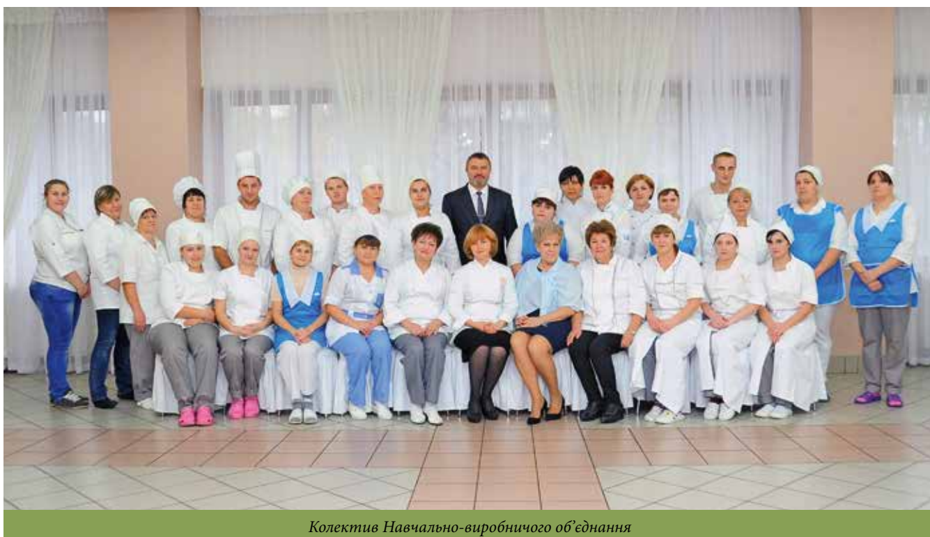
Колектив Навчально-виробничого об'єднання

Підрозділ досліджує та аналізує потреби споживачів у складних умовах сьогодення, намагається реагувати на них: вивчаються нові види продукції та страв, вироб-