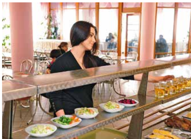
У студентській їдальні