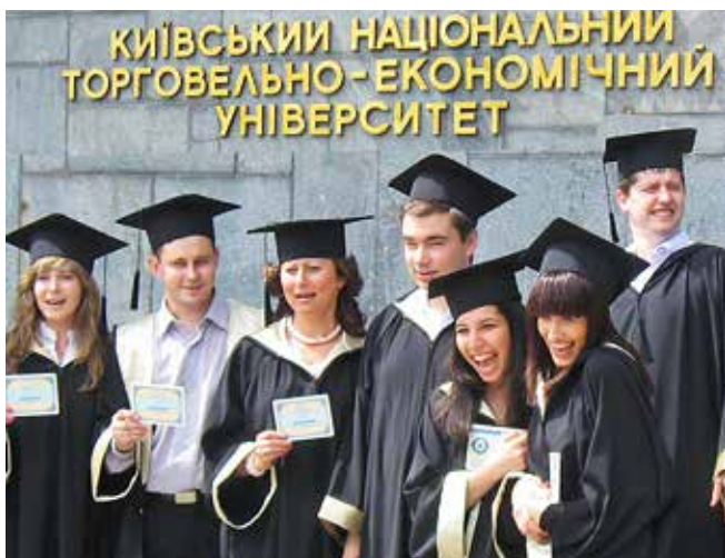
Випускники-магістри спеціальності «Банківська справа», 2008 р.

з Університетом МакГілл (м. Монреаль, Канада) в рамках проекту «Регіональне навчання та розвиток консультативних можливостей в Україні», створено Український консорціум університетів, до якого також увійшов ІВК. Проект надав можливість здійснювати навчання та консультування малого та середнього бізнесу, а також навчання викладачів та розвиток навчальних програм, що сприяло інтенсифікації розвитку малого та середнього підприємництва в Україні.