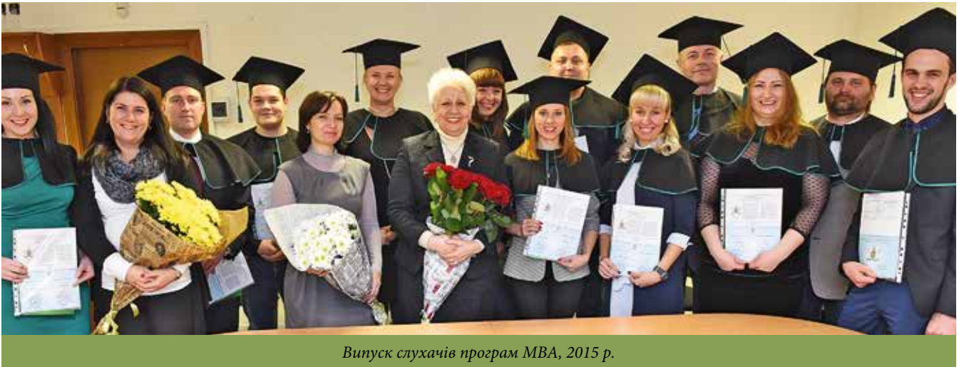
Випуск слухачів програм MBA, 2015 р.

вої програми з питань вивчення нового законодавства; укладено договір з Університетом ім. Г. Марконі щодо реалізації спільної програми подвійного диплому International Master's in Business Administration» (IMBA); вперше в Україні відкрито нову програму MBA-Бренд-менеджмент; за результатами дослідження, проведеного газетою «БИЗНЕС» інститут отримав статус «Найкращої університетської бізнес-школи».