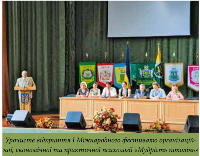
Урочисте відкриття I Міжнародного фестивалю організаційної, економічної та практичної психології «Мудрість поколінь»

за результатами яких були створені сучасні діагностичні методики, зокрема «ПРОФІ». Співробітники Центру брали участь у розробці теми «Дослідження основних стратегій підвищення якості освіти в КНТЕУ». У 2008–2010 рр. розроблена НДР «Методологія дослідження світових інтелектуальних технологій та їх впровадження в систему вищої освіти України». В 2011–2012 рр. співробітниками реалізовувався, спільно з кафедрою філософських та соціальних наук, інноваційний проект «Розробка основних стратегій формування творчої особистості в КНТЕУ». В рамках проекту було проведено 7 соціологічних досліджень серед студентів та створена спеціальна комп'ютерна програма для тестування «Три компетентності».