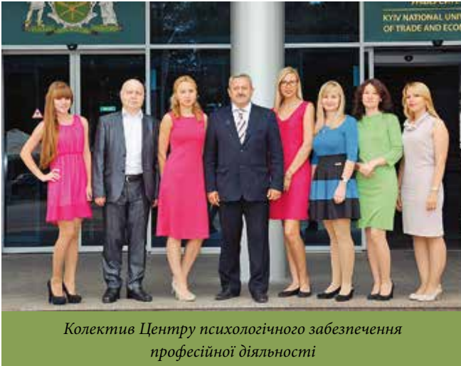
Колектив Центру психологічного забезпечення професійної діяльності