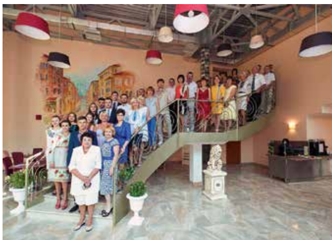
Відкриття університетського кафе «Венеція»