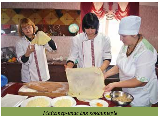
Майстер-клас для кондитерів