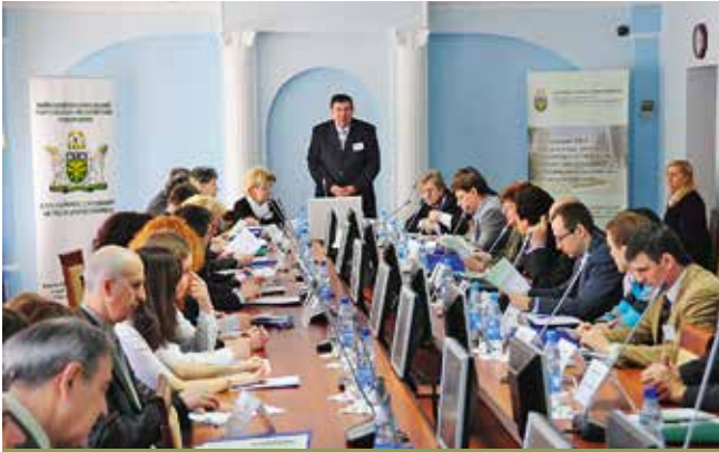
V Міжнародний бізнес-форум «Проблеми та перспективи розвитку інноваційної діяльності в Україні»