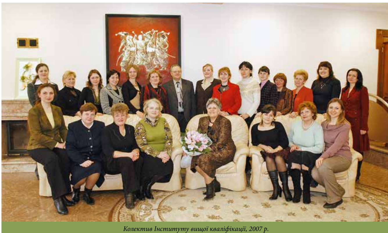
Колектив Інституту вищої кваліфікації, 2007 р.

У 2001–2002 рр. Інститут вищої кваліфікації взяв участь у конкурсі і отримав право на реалізацію президентської Програми перепідготовки управлінських кадрів для сфери підприємництва «Українська ініціатива». Програма передбачала організацію широкомасштабної перепідготовки управлінських кадрів для сфери підпри-