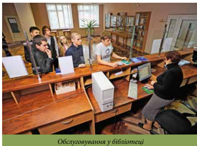
Обслуговування у бібліотеці