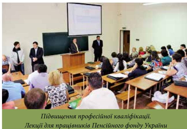
Підвищення професійної кваліфікації. Лекції для працівників Пенсійного фонду України