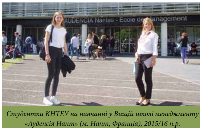
Студентки КНТЕУ на навчанні у Вищій школі менеджменту «Ауденсія Нант» (м. Нант, Франція), 2015/16 н.р.