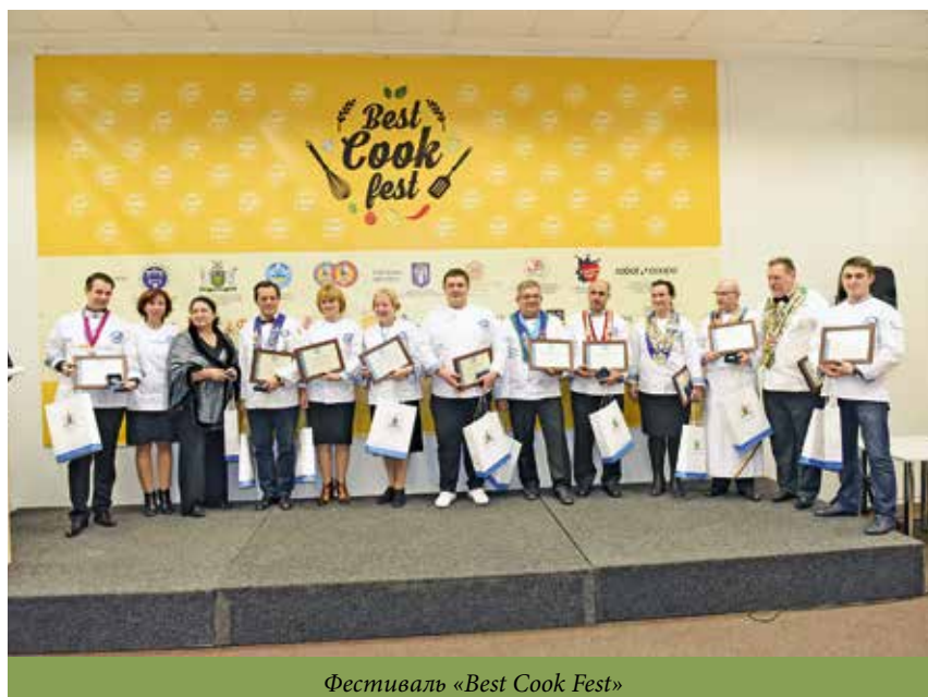
Фестиваль «Best Cook Fest»

томатів, а також за необхідності та на вимогу споживачів створюються буфети пересувної торгівлі. У 2014 р. відкрилося кафе у корпусі «А», у 2015 р. — сучасне й стильне кафе у корпусі «Б», які відразу стали улюбленими у молоді.