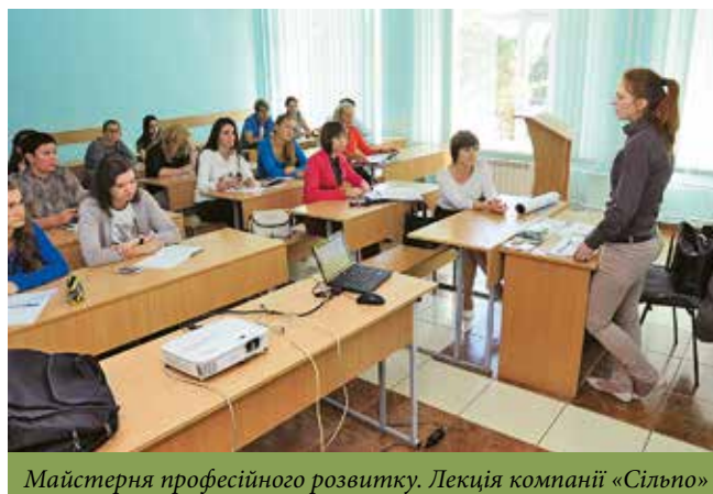
Майстерня професійного розвитку. Лекція компанії «Сільпо»

звичних стендових експозицій, проходили презентації програм стажування компаній, майстер-класи, тренінги, воркшопи.