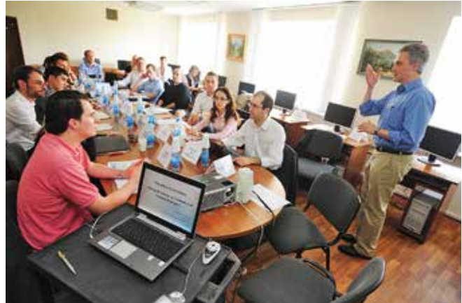
Семинар «Бізнес в Україні» для топ-менеджерів з Європи

Наступний рік був ознаменований проведенням підсумкової міжнародної науково-практичної конференції «Співпраця університетів і бізнесу: навчання та розвиток консультативних можливостей в Україні» спільно з Університетом МакГілл (м. Монреаль, Канада). У рамках співробітництва з ESCP Europe впроваджено англomовний навчальний модуль «Економічна теорія для менеджерів» та семінар «Бізнес в Україні» для топ-менеджерів з Європи. За період реалізації проекту навчання пройшли близько 60 осіб — представників провідних компаній різних сфер бізнесу (промисловість, банківська сфера, консалтинг тощо) з країн Європейського Союзу (Швеції, Німеччини, Франції, Словенії, Італії, України, Словаччини, Болгарії, Польщі, Голландії й Португалії) та США. Розроблено першу корпоративну професійну програму для компанії «Ашан Україна Гіпермаркет».