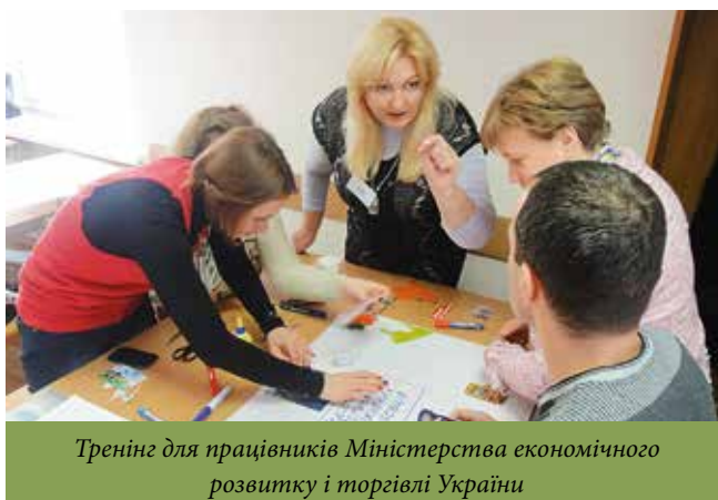
Тренінг для працівників Міністерства економічного розвитку і торгівлі України