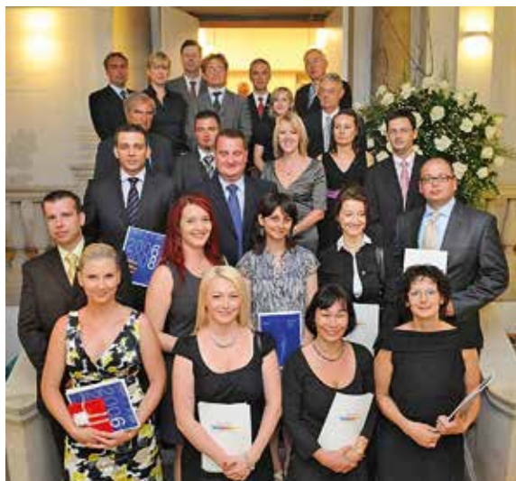
Випуск програми СеМВА, м. Берлін, 2008 р.

з питань державної служби ІВК вибором право на підвищення кваліфікації державних службовців з мовної підготовки та за модулем «Адаптація державної служби України до стандартів Європейського Союзу» Тренінго-