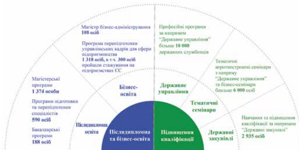
Випуск слухачів в Інституті вищої кваліфікації КНТЕУ за період 2000–2015 рр. (понад 22 тис. осіб)

Період 2012–2013 рр. пройшов у активній співпраці зі Школою вищого корпусу Нацдержслужби України щодо реалізації Професійної програми підвищення кваліфікації державних службовців та посадових осіб місцевого