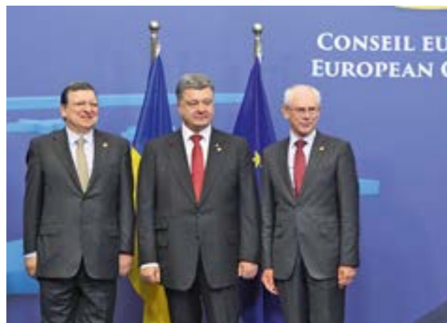
Церемонія підписання економічної частини Угоди про асоціацію між Україною та ЄС, 27 червня 2014 р.

а реальною. Як частина східноєвропейської культури й цивілізаційної спільноти Україна неминуче робить європейський вибір.