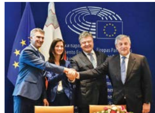
Урочиста церемонія підписання рішення ЄС про запровадження з 11 червня 2018 р. безвізового режиму між Україною та ЄС

Україна має всі передумови для переходу до того цивілізаційного середовища, якому притаманна організація державного устрою