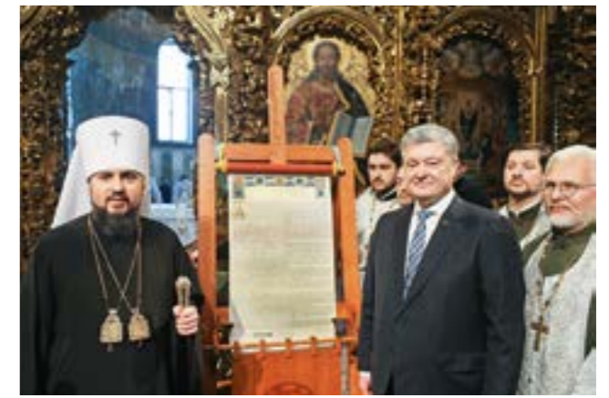
6 січня 2019 р. Православна Церква України отримала Томос про автокефалію (незалежність), який підписав Вселенський Патріарх Варфоломій у присутності Президента України Петра Порошенка, Митрополита Київського та всієї України Епіфанія та численної української делегації

Зміна цивілізаційної парадигми національного розвитку неминуче призведе до ряду