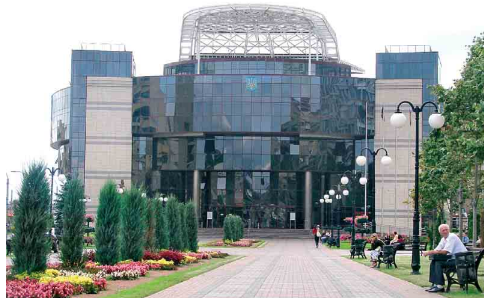
Районна державна адміністрація в місті Києві (Солом'янський р-н)

м. Київ, пр-т Московський, 20 б, 6 поверх Тел./факс: (044) 461-98-70 www.ursa.com.ua, ursa.ua@uralita.com