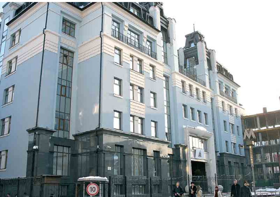
Міністерство фінансів України, м. Київ

Компанія URSA належить до іспанського концерну Grupo Uralita, який було створено у 1907 році. На сьогодні це один із провідних європейських виробників будівельних матеріалів. Основними напрямками у діяльності концерну є покрівельні та теплоізоляційні матеріали, трубопровідні системи й штукатурні покриття. Група компаній представлена на ринках 35-ти країн, має 38 виробничих підприємств, штат співробітників складає близько 4000 фахівців.