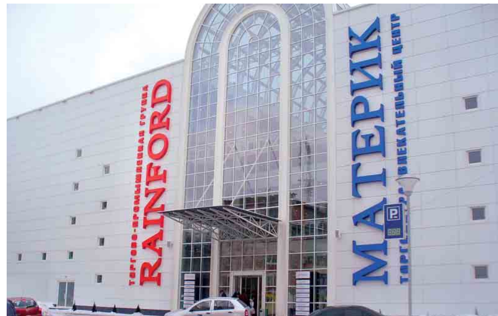
ТРЦ «Материк» (м. Дніпропетровськ)