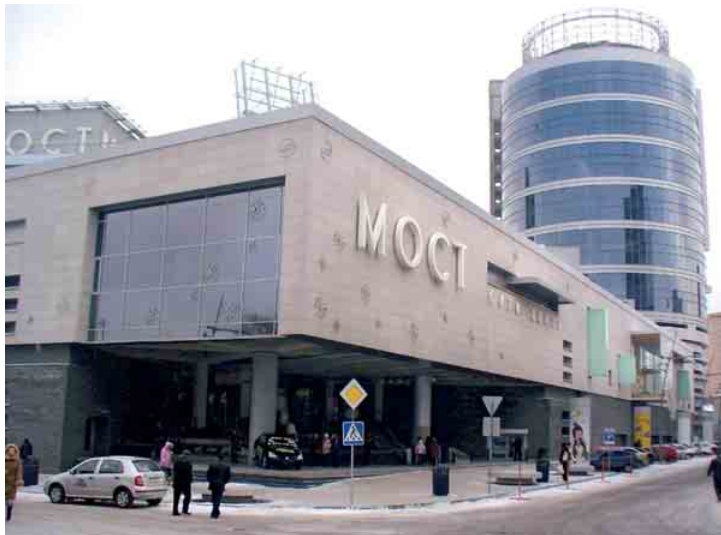
ТРЦ «Мост-Сіті» (м. Дніпропетровськ)

актуальною. За статистичними даними на сьогодні в Україні на опалювання будівель щорічно витрачається близько 30% загального споживання теплової енергії, у порівнянні з країнами Західної Європи, що мають схожий клімат – це вдвічі більше. Для того, щоб максимально зберегти тепло в будівлі та зменшити витрати палива, а відтак і коштів, необхідно застосовувати енергозберігаючі конструкції з використанням сучасних теплоізоляційних матеріалів. Компетентно розрахована й змонтована система теплоізоляції дозволяє заощадити значну кількість енергії впродовж усього року: взимку – за рахунок зменшення тепловтрат будівля споживає значно менше теплової енергії; влітку – охолоджене повітря у приміщенні тримається значно довше, зменшується кількість електрики, що витрачається кондиціонерними установками. Крім того, теплоізоляційні матеріали є звукоізоляцією, яка створює акустичний комфорт у приміщенні.