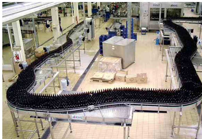
Виробнича лінія (завод «Славутич»)