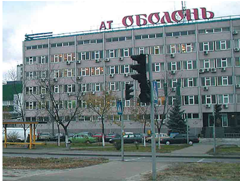
ЗАТ «Оболонь» (м. Київ)

ДП «Укрдіпрохарчпром», як головний державний інститут з проектування підприємств харчової промисловості, за результатами атестації наукових установ віднесений до категорії «А» – організації (фундаментального, науково-технічного, проектно-впроваджувального спрямування), що можуть визначати та впливати на державну науково-технічну політику.