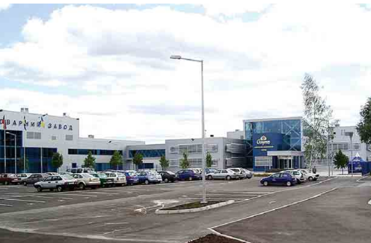
Пиво-безалкогольний завод «Славутич» (м. Київ)

При безпосередній участі інституту «Укрдіпрохарчпром» побудовані і реконструйовані: всі винзаводи первинного і вторинного виробництва в АР Крим, Херсонській і Миколаївських областях; солодові заводи у м. Бердичеві, Мукачеві; найбільший на той час в Європі солодовий завод у м. Славути, Хмельницької області; ТЕЦ майже всіх цукрових заводів в Україні; оліє-жировий комбінат у м. Запоріжжі; заводи по видобутку та розливу мінеральних вод у Миргороді, Сваляві, Саках; завод «Пепсі-Кола» у м. Євпаторія