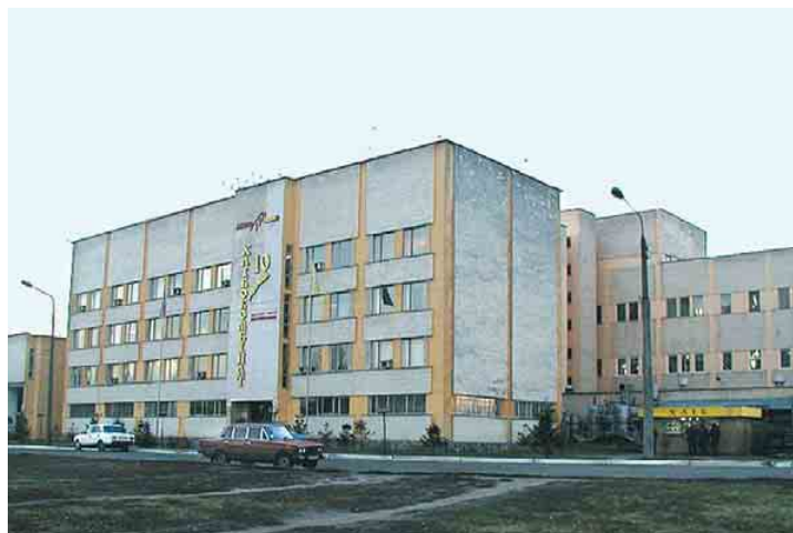
Хлібокомбінат №10 (м. Київ)