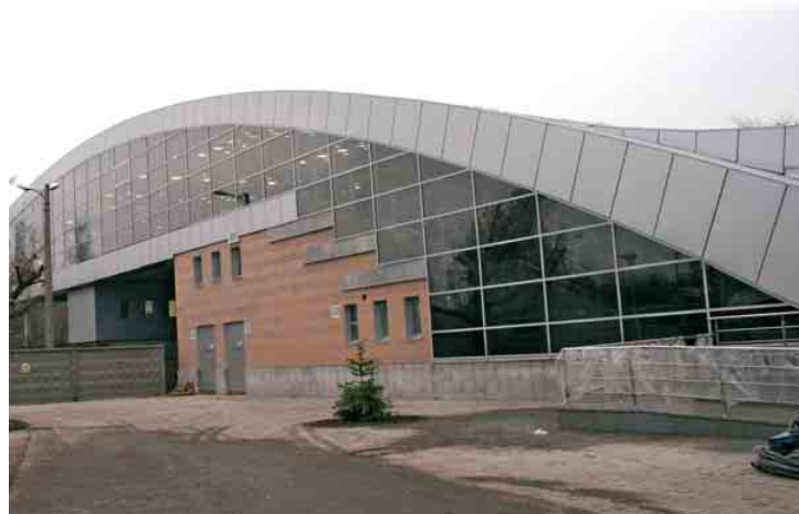
Другий вихід станції метро «Дарниця»

ВАТ «Київметробуд», 01034, м. Київ, вул. Прорізна, 8 тел. 278-19-62 т./ф. 279-38-84 www.metrobud.kiev.ua