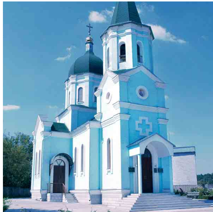
Церква Покрови Пресвятої Богородиці в с. Кийлів