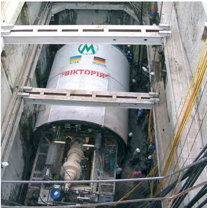
Тунеліпрохідницький комплекс у монтажній камері