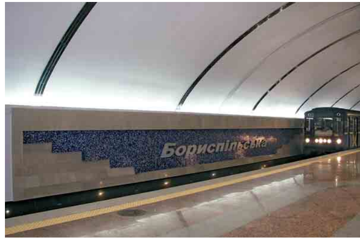
Платформа станції метро «Бориспільська»