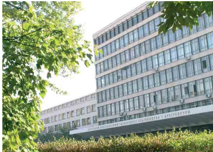
Тут навчають фахівців будівельної справи (2008)

Розвивалась та зміцнювалась матеріально-технічна база інституту, організовувались нові факультети, помітно збільшилась кількість студентів. Колектив викладачів поповнився вченими вищої