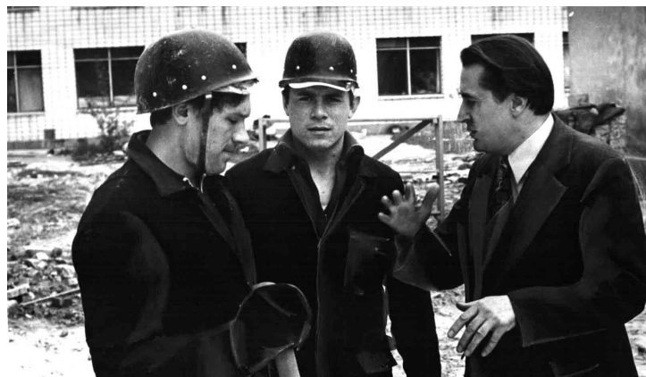
Студенти на будівництві чергового корпусу КІБІ (1976)

З-під пера ректора, академіка Академії інженерних наук України А. М. Тугая вийшло понад 200 наукових праць, 17 підручників і посібників, 5 довідників, 7 монографій, підготував чотирьох кандидатів наук. За сумлінну та плідну працю, спрямовану на розвиток національної і вищої освіти й науки в галузі будівництва і архітектури, та підготовку висококваліфікованих кадрів академік Анатолій Михайлович Тугай був нагороджений орденом «Знак Пошани», «Дружби народів», «За