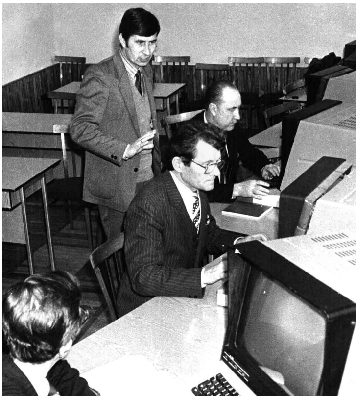
Ректорат КНУБА опановує комп'ютер (1990)

архітектури, українського народного зодчества... Писати про нього можна дуже багато, та справжній людський геній не вимагає офіційного визнання і винагород, він з'являється на вершині пошани і любові своїх учнів, колег, послідовників.