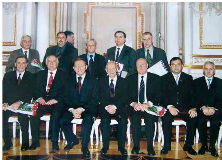
Науковці КНУБА – лауреати Державної премії у галузі науки і техніки України (2003)

Цей заклад є однією з найвідоміших шкіл будівельного навчання, храм освіти, науки і культури, що був заснований у 1930 році.