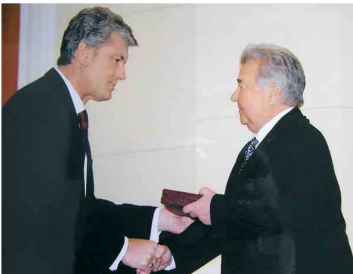
Диплом лауреата Державної премії в галузі науки і техніки 2008 року Президент України В.А.Ющенко вручає д.т.н., професору КНУБА А.Я.Барашникову