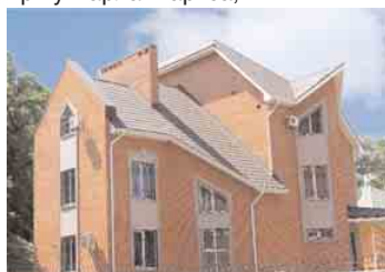
Житловий будинок (м. Дніпропетровськ)