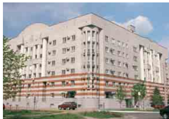
Житловий будинок (Ливарна, 9)